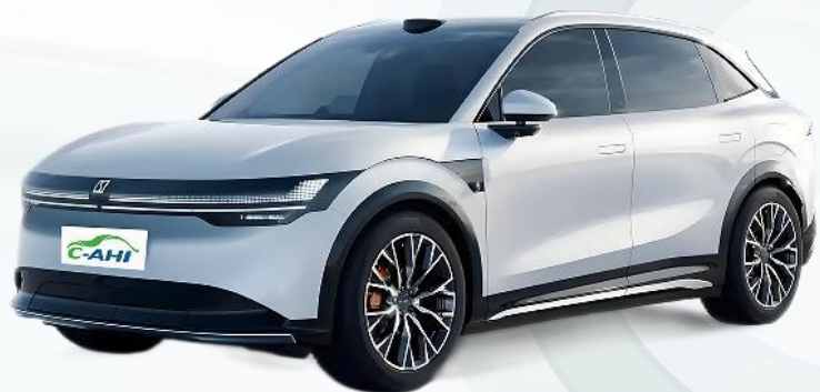
后驱智驾版 纯电动多用途乘用车