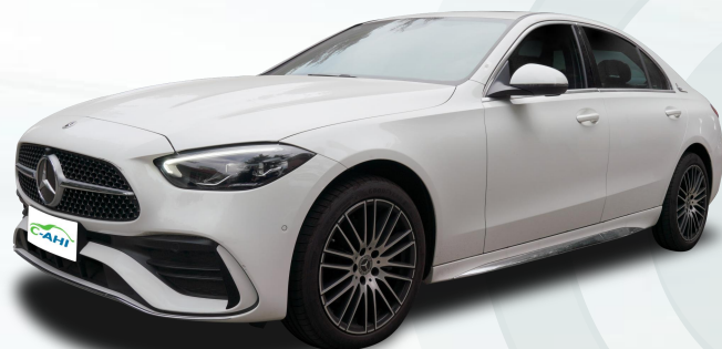
2023款 C200L 运动轿车