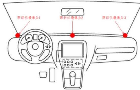
图 1 眼动仪安装位置