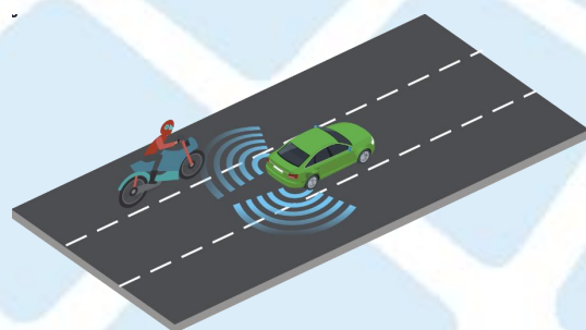
两轮车识别能力场景